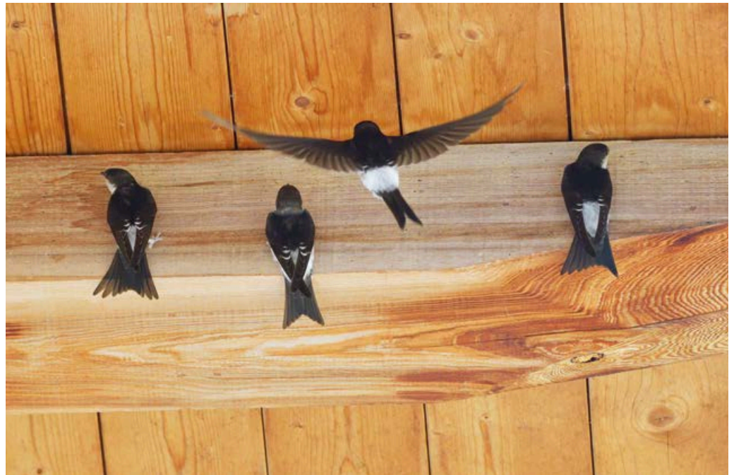
Mehlschwalben, sie sind Koloniebrüter

kimp in denn moment a lkw- fohrer vorbei, schaug an moment und sogg nor: schwestern, enkern glabn mecht i hobn.