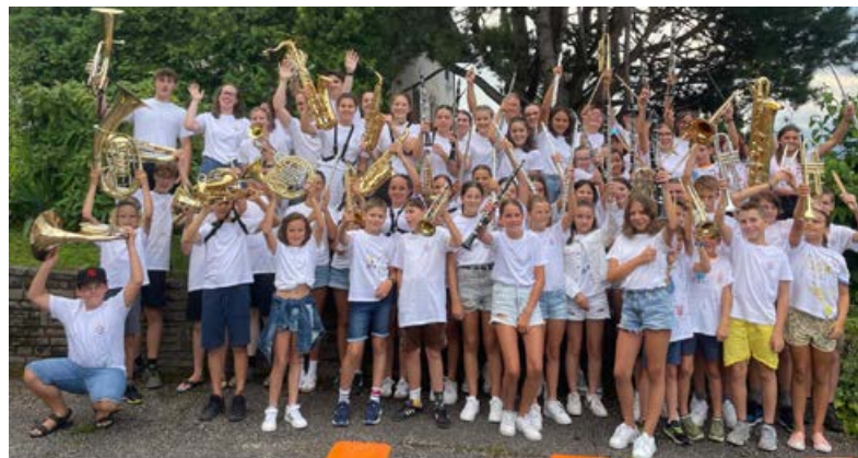
Die heurige Jugendmusikwoche in Buchholz war wieder ein voller Erfolg!