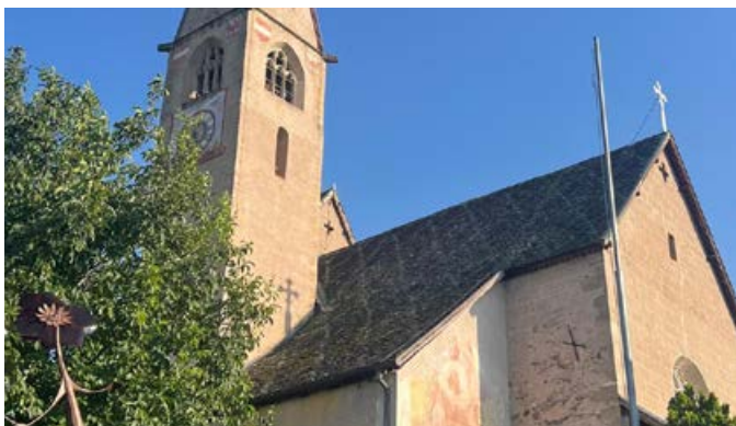
Das Dach der Pinzoner Kirche musste saniert werden

Für die Reparatur des Daches der Stephanskirche in Pinzon hat die Gemeindeverwaltung der Pfarrei einen Investitionsbeitrag in Höhe von 5.500 € gewährt.