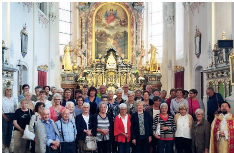
Die Pilgergruppe in der Wallfahrtskirche „Maria Schnee“ in Maria Luggau

Nur wenige Gehminuten von der Wallfahrtskirche entfernt befindet sich das Hotel „Paternwirt“ wo wir zu Mittag aßen. Einige der Gruppe gingen anschließend zum Dorfladen um typische bäuerliche Genussprodukte aus der Region zu kaufen.