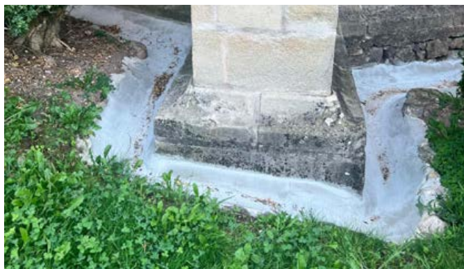
Die Arbeiten an den Wasserrinnen am Friedhof in Pinzon wurden bereits abgeschlossen

Die Wasserrinnen in Beton für das Regenwasser im Friedhof von Pinzon sind in einem sehr schlechten Zustand und müssen dringend saniert werden, um ein Eindringen von Regen- und Oberflächenwasser in die Stephanskirche zu verhindern. Die Firma Thaler Franz KG mit Sitz in Montan a.d.W. wurde mit der Durchführung von Sanierungsarbeiten im Friedhof von Pinzon mit einem Gesamtbetrag von 5.490 € beauftragt.