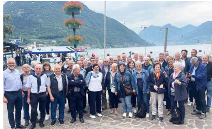
Die glücklichen Gewinner der Raiffeisenkasse Unterland genossen eine exklusive Führung in Franciacorta und einen entspannten Tag auf Monte Isola.

am Seeufer – Monte Isola bot für jeden etwas und lud zum Verweilen ein. Am späten Nachmittag kehrte die Gruppe voller neuer Eindrücke zurück. Es war ein schöner Tag in bester Gesellschaft.