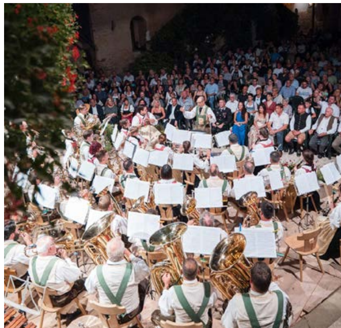
Die Musikkapelle begeisterte heuer zum 36. Mal die Konzertgäste im malerischen Innenhof von Schloss Enn

Nach den Ansprachen ging es weiter im Programm mit der „Ap-