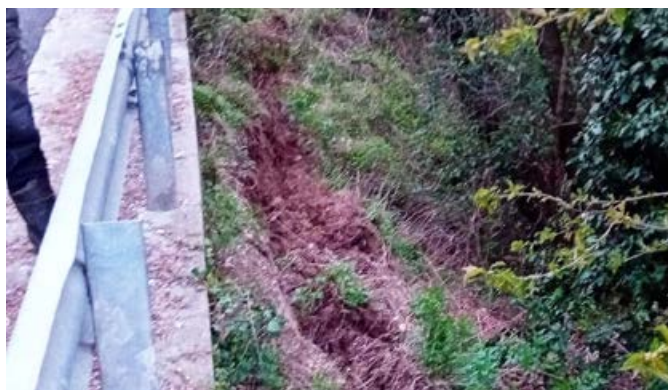
Die Schadstelle an der Gemeindestraße in Hinterglen

Durch die anhaltenden Regenfälle und Gewitter im Frühjahr/Sommer 2024 ist an der Gemeindestraße in Hinterglen (Zone Kalterer) eine Schadstelle entstanden. Nach einem Lokalaugenschein mit dem Landesgeologen wurde beschlossen, ein entsprechendes Projekt zur Behebung der Schäden in Auftrag zu geben. Die Ingenieurgesellschaft Baubüro aus Bozen wurde hierfür mit der Ausarbeitung des Ausführungsprojektes mit einem Gesamtbetrag von 2.283 € beauftragt. In der Zwischenzeit wurde das entsprechende Projekt ausgearbeitet und in verwaltungstechnischer Hinsicht genehmigt, damit beim Amt für Zivilschutz um den vorgesehenen Beitrag angesucht werden kann. Nach Genehmigung der Förderung kann das Projekt mit einem Gesamtkostenpunkt in Höhe von 55.146,94 € durchgeführt werden.