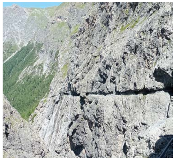
Die Gemeinschaftswanderung führt auf den Schmugglerspuren durch die Uinaschlucht in die Schweiz