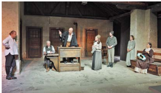
FSU-Freilichtspiele Unterland spielt „Der zerbrochene Krug“ in Montan