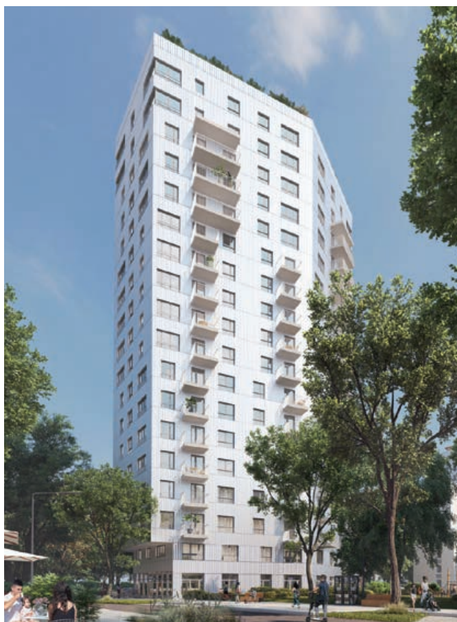
Zurzeit laufen in Deutschnofen die Vorbereitungen für den Bau des 18-Stöckers "Haus Rotondo" - © h4a Gessert+Randecker

tenden sehen über 3D-Brillen, wo welches Bauteil platziert werden muss. Gesorgt ist natürlich auch für Speis, Trank und Unterhaltung, unter anderem mit einer Bastel- und Malecke für Kinder. Interessierte können sich Informationen aus erster Hand zum Thema Holzbau holen. Die Veranstaltung findet bei jeder Witterung statt.