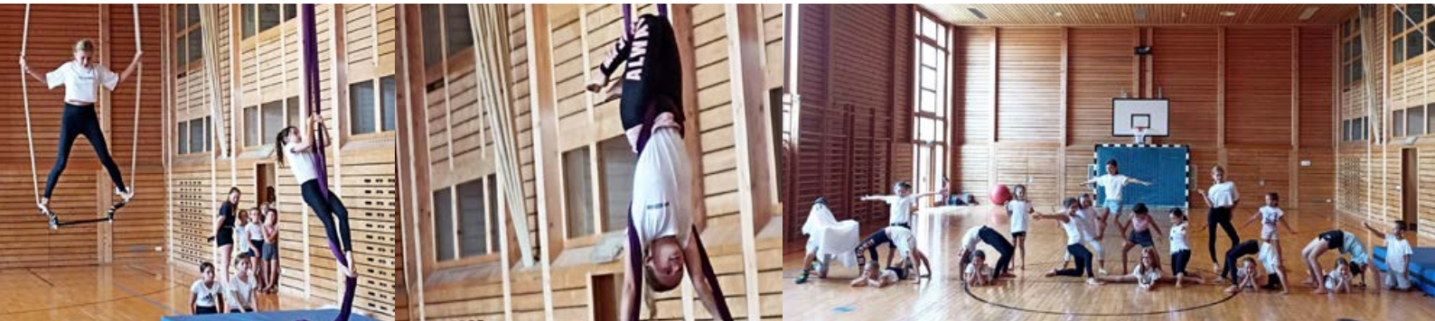
Begeisterte Kinder im Alter von 7 bis 12 Jahren zeigten in der Zirkuswoche ihre beeindruckenden Zirkuskünste bei einer spannenden Gespenstershow