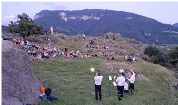
Das Blechbläserquintett ‚Cinquino Brass Quintet‘ begeisterte Ende Juli das Publikum mit einem Konzert unter freiem Himmel auf der Ruine Castelfeder