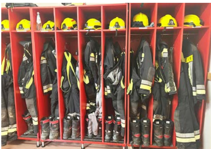
Die Einsatzbekleidung der Feuerwehr muss ausgetauscht werden

Die Freiwillige Feuerwehr Montan wird in den nächsten drei Jahren die Einsatzbekleidung schrittweise austauschen. Die Einsatzbekleidung der Feuerwehrleute hat mittlerweile ein Alter von 15 Jahren, weist durch den Gebrauch bei den Einsätzen und Übungen starke Gebrauchsspuren auf und stellt somit ein Sicherheitsrisiko für die Wehrmänner dar. Die Gemeinde Montan a.d.W. wird diese Anschaffung in Höhe von 75.000 € mit einem Beitrag von 30.000 € für den Zeitraum 2024 – 2026 mittragen. Die Restfinanzierung wird durch weitere Beiträge sowie Eigenmittel der Feuerwehr gesichert.