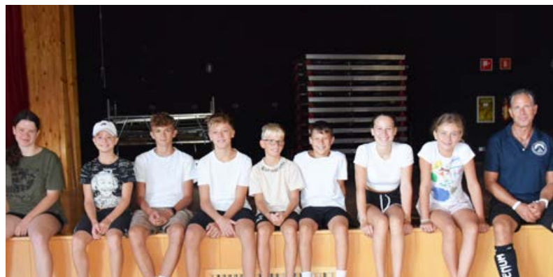
Zehn Jugendliche nahmen am Selbstverteidigungskurs teil