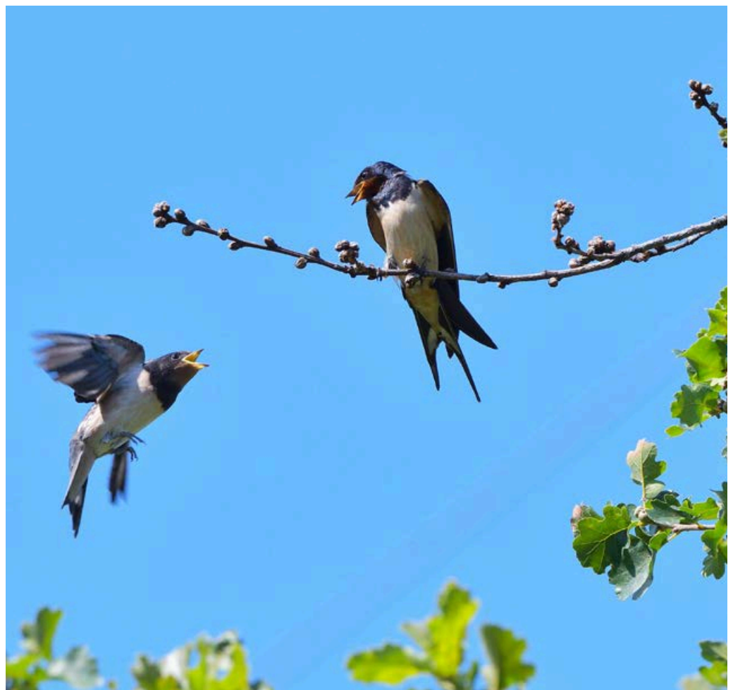
Rauchschwalben, Jungvogel links mit Altvogel