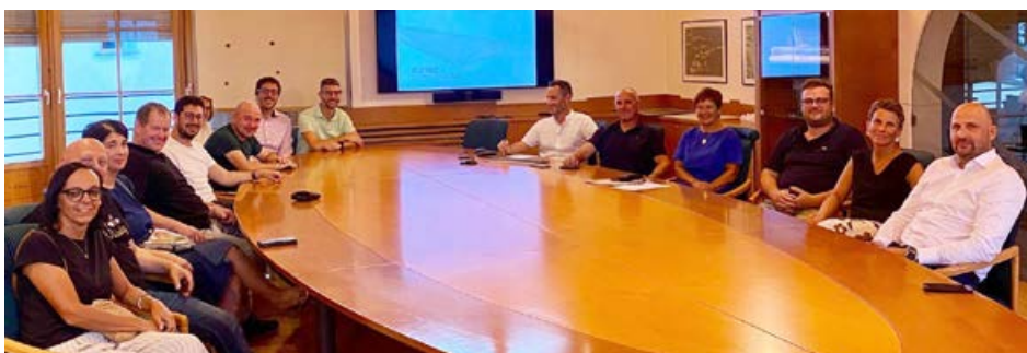
Die Machbarkeitsstudie zur Errichtung eines „Kiosks“ am Dorfplatz wurde im Ratssaal vorgestellt.

es besteht das Problem der Beschädigung durch das Anfahren von Fahrzeugen, das Vor- und Rückstellen der Einrichtung ist im Hinblick auf die Langlebigkeit fraglich. Es wurde angeregt eventuelle eine Lösung im hinteren Bereich der Rundung anzudenken, wodurch kaum Parkplatz verloren ginge. Einhellig ist man der Meinung es soll die Getränkeausgabe und Kühlung von Getränken ermöglicht sein und auch eine Kochgelegenheit geschaffen werden. Anschlüsse für Strom, Wasser und Abwasser sollen vorgesehen werden. Es kam auch der Vorschlag einer mobilen Lösung, welche dann auch für Feste an anderen Standorten verwendet werden kann. Die Errichtung des unterirdischen Lagers, welche auch den Gewinn einer ebenen Fläche ober Erde mit sich bringt soll beibehalten werden. Nun wird die Gemeinde die Vorschläge mit dem Projektanten vertiefen.